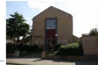
Medanstraat 32 (noord) Pinkstergemeente Immanuel