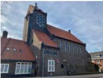
Kinderhuissingel 76 (centrum) Anna en Mariakathedraal