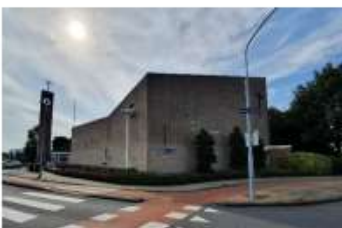
Stephensonstraat 9 (zuidwest) Pelgrimkerk