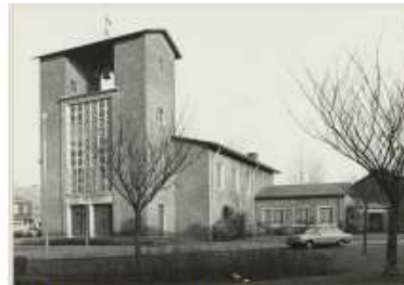
Eksterlaan 1 (noord) Sionskerk/Shelter