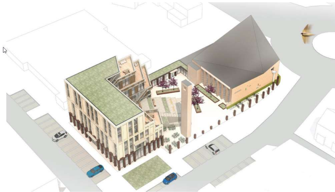
De Pelgrimkerk wil maatschappelijke functies onderbrengen in een nieuw gebouw verbonden met de monumentale kerkzaal