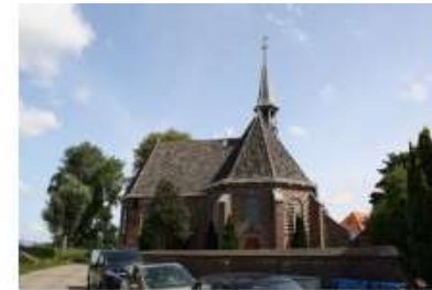
Kerkplein 2 (Spaarndam) Oude Kerk