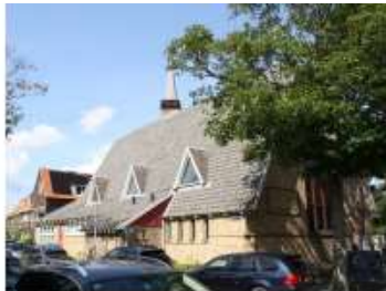
Rechthuisstraat 9 (noord) Goede Herderkerk