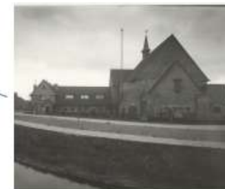
Zomerkade 165 (oost) Oosterkerk