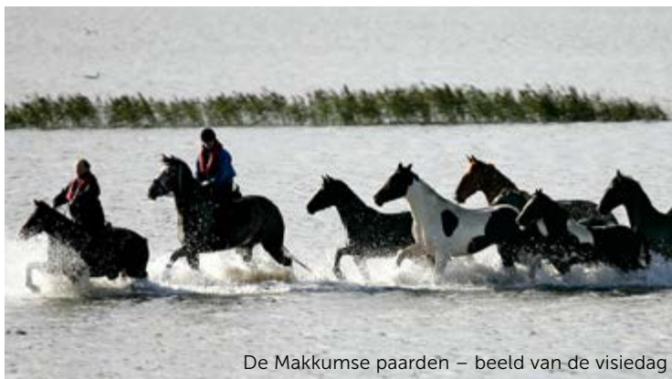
De Makkumse paarden – beeld van de visiedag